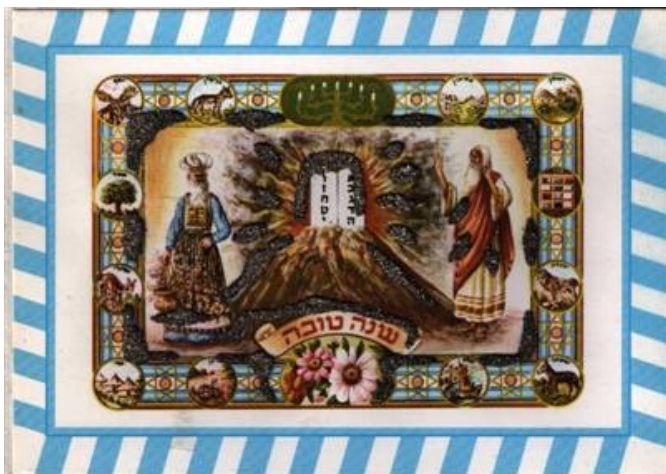
Joodse Nieuwjaarsgroet met Mozes en Aaron

De maanden van de Joodse kalender vallen volledig samen met de maanstanden. Op de eerste dag is het Nieuwe Maan, en 's nachts is het behoorlijk donker. De nacht valt in het subtropische Israël heel snel in, een avond-schemering bestaat er niet. Als kampeerder moet je om half zeven de tent opgezet en de slaapzak uitgerold hebben, want om zeven uur is het ècht donker.